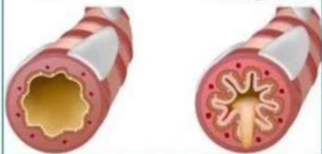
Суженные бронхи с мокротой

Не занимайтесь самолечением! При наличии симптомов обратитесь за консультацией к специалистам!